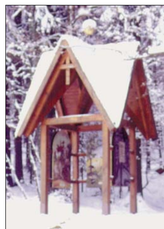
Pavillon beim Naturlehrpfad der Berg- u. Naturwacht