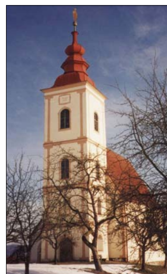
Wallfahrtskirche St. Anna

N ach der Grundentlastung gingen in der Mitte des 19. Jahrhunderts die Grundherrschaften in Bezirksgerichte auf. Kirchbach wurde Sitz eines Bezirksgerichtes mit 25 Gemeinden und 14.500 Einwohnern. Außerdem gab es in Kirchbach ein k. u. k. Steueramt, einen Notar, einen Advokaten, den Sitz des Bezirksschulrates und eine Filiale der k.u.k. Landwirtschaftsgesellschaft.