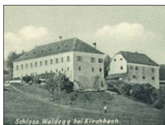
Schloss Waldegg 1898