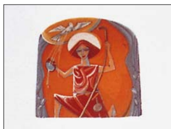
Detail eines Eckturmes der Kirchhofmauer der Pfarrkirche